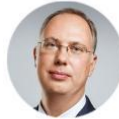
Дмитриев Кирилл Российский фонд прямых инвестиций (РФПИ), Генеральный директор;